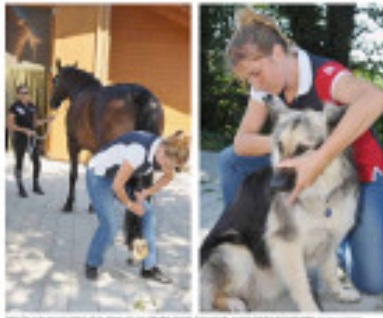
Elle aime les chiens, mais elle n'a jamais été pincée, ni mordue. Elle raconte son expérience de la garde d'animaux.

UNE FEMME Elle aime les chiens, mais elle n'a jamais été pincée, ni mordue. Elle raconte son expérience de la garde d'animaux.